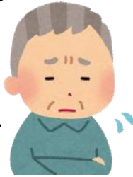
【本人・事業対象者・要支援者】