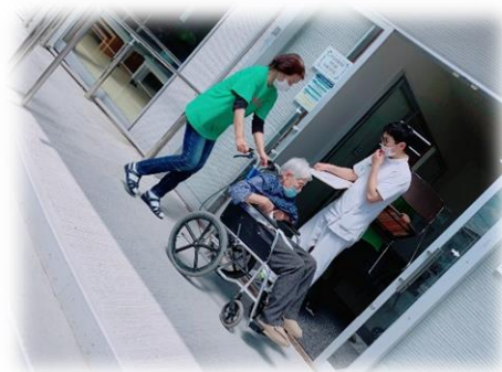
← (逃げ遅れ防止のため車椅子を使用して移動中)