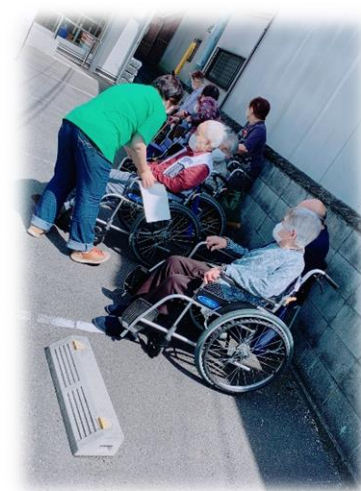
↑ (気分が悪くないか、確認中)