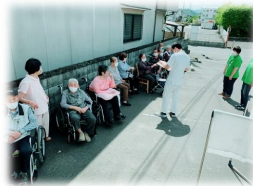
↑ (利用者様とスタッフの点呼をし安否確認中)

5月19日(水)午後2時からセカンドで避難訓練を行いました！出火元をキッチンという設定で訓練を行い利用者様が火事の際にどうしたらいいか、対応を改めて再確認しました。